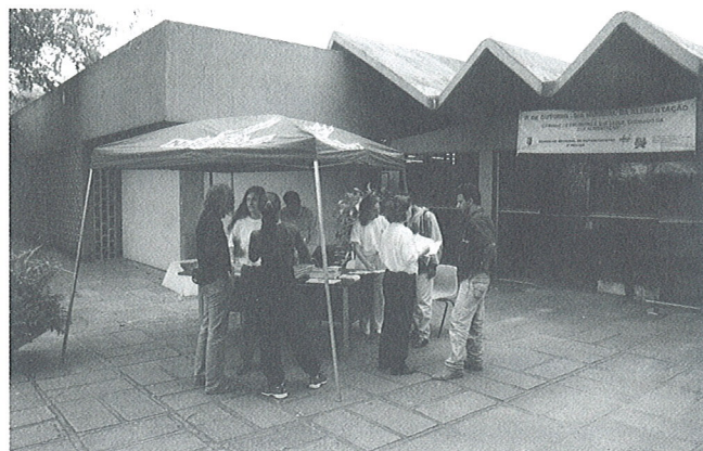
Posto de orientação nutricional na Faculdade de Educação Física da USP.

Vários eventos promovidos pelo CRN-3 marcaram o Dia Mundial da Alimentação, comemorado em 16 de outubro.