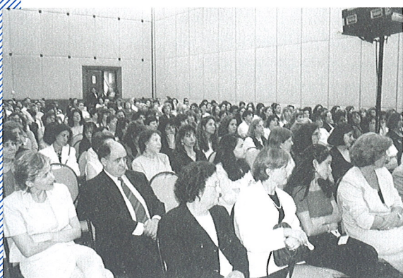
Nutricionistas prestigiam evento realizado pelo CRN-3 em comemoração ao 31 de agosto.

Em um mundo cada vez mais globalizado, onde a atuação dos profissionais de Nutrição exige uma preparação cada vez mais abrangente e ao mesmo tempo complexa, o CRN-3 decidiu comemorar o Dia do Nutricionista com um evento que abordou temas atuais, polêmicos e principalmente, sintonizados com o futuro da profissão no País e no mundo.