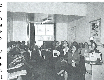
Encontros de Reflexão dos CRN's reúnem conselheiros de várias partes do País.

Em Brasília também já foram definidas as sedes dos Regionais onde serão realizados os próximos Encontros, ainda neste ano: O V Encontro será no CRN-6, em Recife; o CRN-7, em Belém, sediará o VI Encontro; o VII Encontro acontecerá na sede do CRN-5, em Salvador.