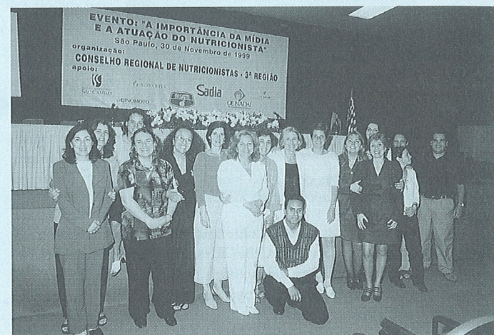
Conselheiras, fiscais e colaboradores do CRN-3, juntamente com a diretoria, prestigiam o evento da Comissão de Atuação junto à Mídia.