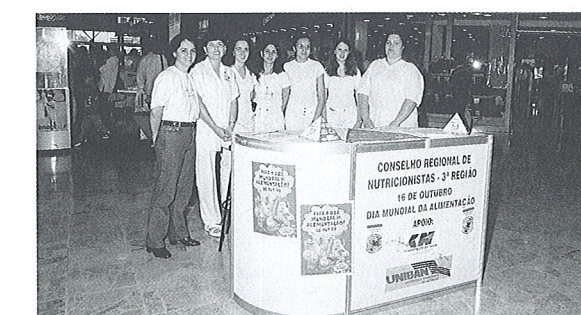
Equipe do CRN-3 monta postos de orientação nutricional para a população em várias cidades. Na foto, posto do Shopping Center Norte - SP.

No decorrer das atividades, foram fornecidas orientações sobre uma alimentação correta, com algumas dicas básicas, porém essenciais, para se adotar no dia-a-dia, tendo sido passados os locais implantados pelas Universidades (Clínicas de Nutrição) para atendimento ao público.