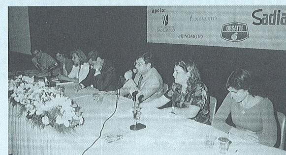
Palestrantes esclarecem dúvidas do público participante.