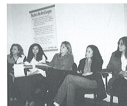
Representantes do CRN-3 marcaram presença no encontro do Rio de Janeiro.

No evento do Rio de Janeiro, destaque deve ser dado ao Projeto de Interiorização da Ação Fiscalizatória dos